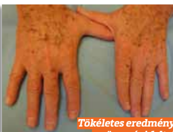
Tökéletes eredmény: az öregségi foltok eltűnnek