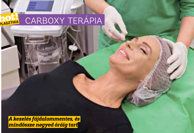
A kezelés fájdalommentes, és mindössze negyed óráig tart